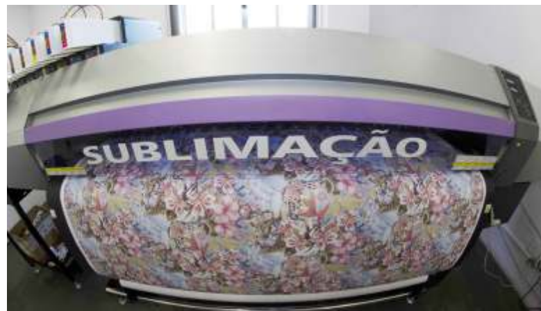
*Estamparia Digital Sublimada

A Advance Têxtil oferece Estamparia Digital, e Estamparia Digital Sublimada, ambos processos permitem estampas sem limitação de cor e rapport com efeitos fotográficos em alta definição.